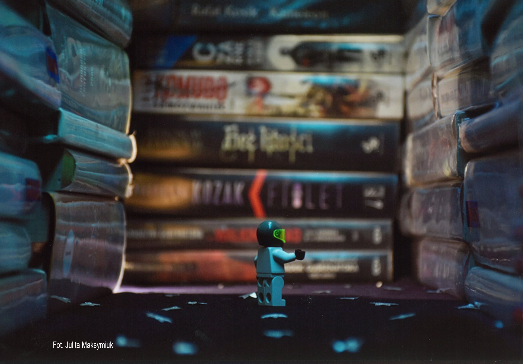
Fot. Julita Maksymiuk